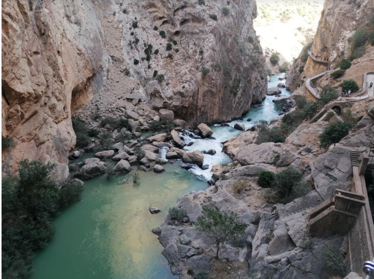
Caminito Del Rey