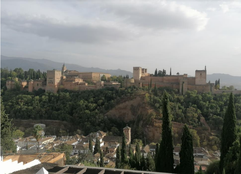
Granada és az Alhambra