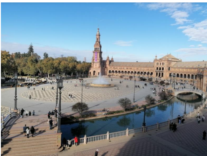
Plaza De Espana, Sevilla