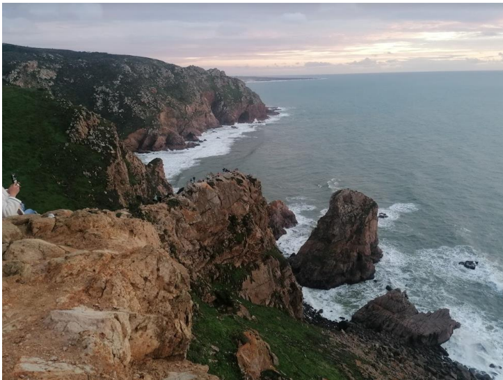
Cabo Da Roca, az európai főkontinens legnyugatabbi pontja